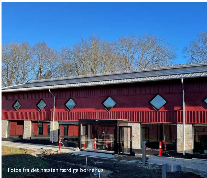
Fotos fra det næsten færdige børnehus

Grønnegården, nyt børnehus i Mørkhøj. Danmarks første klimaneutrale børnehus. Udviklet af Gladsaxe Kommune i samarbejde med totalrådgiver BBP Arkitekter. Indvies i februar 2022.